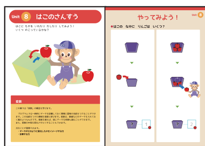
幼児コースカリキュラム例

ナチュラルスタイルが子供向けプログラミング学習用に整備した基本カリキュラムです。将来プログラマーを目指す子供達には勿論、そうでない子供達においても、21世紀型スキルとして必要なプログラムの基礎概念を体系化致しました。「ぴこらぼくん」においては、この「めあて」をベースにしたオリジナルカリキュラムを新たに準備しました。